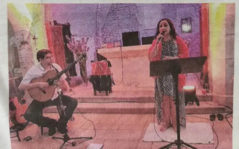
Balade musicale à travers les continents.

Buvette et restauration sur place. Entrée libre